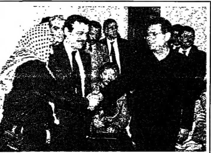
عرفات يصالح بن تانان

قال وزير الخارجية السوفياتي اواردي شيفاردنازه امس ان الاتحاد السوفياتي سيدعم العلاقات مع اسرائيل اذا حضرت مؤتمرا دوليا للسلام في الشرق الاوسط وبدأت محادثات مع منظمة التحرير الفلسطينية. وقال الوزير السوفياتي في مؤتمر صحفي عقبه في القاهرة انه حتى تكف اسرائيل عن رفض عقد مؤتمر دولي واجراء حوار مع منظمة التحرير الفلسطينية سيمكن لاسرائيل والاتحاد السوفياتي ان يخطيا خطوة اخرى الى الامام في طريق إعادة العلاقات الدبلوماسية الكاملة. اما بداية المؤتمر فمن شأنها ان تشكل بدءا لاستئناف هذه العلاقات. وفيما يلي مقتطفات لابز نقاط النص الرسمي لبيران وزير الخارجية السوفياتي. ان الشرق الاوسط هو متحف حضارات زالت واذا لم يحل النزاع العربي الاسرائيلي خلا سياسيا سلميا وشاملا فان تطور الاحداث في المنطقة قد يجري على طريق لولبي يوجهه منطق لمواجهة العسكرية. وتهدد المنطقة بسباق التسليح الذي يمكن ان يتحول عاجلا او اجلا الى مواجهة ثورية. والزمن في الشرق الاوسط لا يعمل لصالح السلام بل للحرب والحفاظ على الوضع الحالي يؤدي لا الى الغالبية بل الى الانفجار. (البيعة على الصفحة ٩)